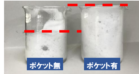
泡立てネットに入れて10秒間の泡立てた量の一例

今回の泡立て時短ポケットは、その泡が出来る仕組みに着目して、あらかじめ石鹼へ水を貯水できるポケット(すり鉢型)を作ることによって、泡立ての際に何度も加水することなく、洗顔に程よい量の泡を一気に作り上げることを実現しました。